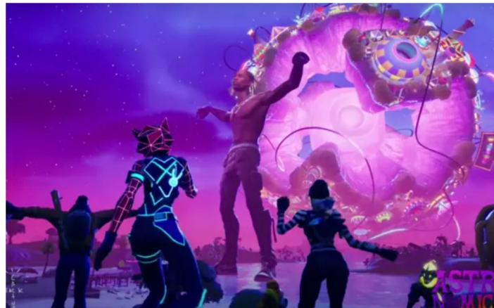
Marshmello concierto en Fornite 2019